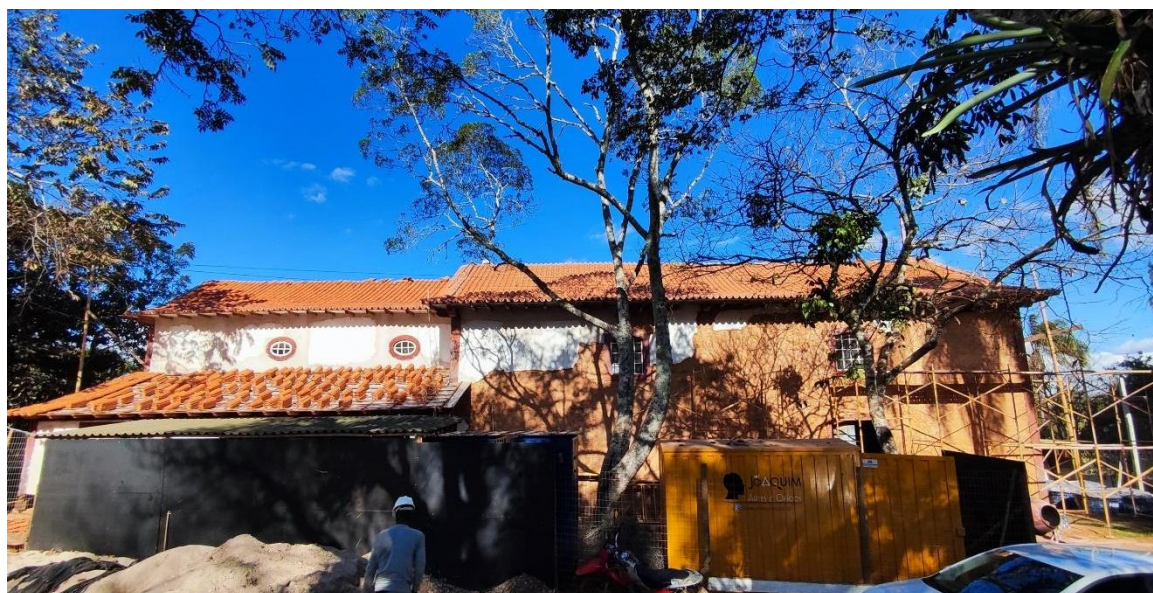
Intervenção no telhado da edificação Data: 05/08/2024

As atividades restaurativas previstas no escopo do projeto estão em andamento, tendo sido executados até o momento da visita técnica a remoção do telhamento e troca do madeiramento comprometido da cobertura dos corredores laterais, da capela-mor e da nave. Os serviços de intervenção nas coberturas da sacristia estão em andamento. Conforme informado nas reuniões de monitoramento e na visita técnica de acompanhamento, o Instituto do Patrimônio Histórico e Artístico de Minas Gerais (IEPHA), solicitou que todas as telhas fossem substituídas por telhas novas, conforme imagens abaixo: