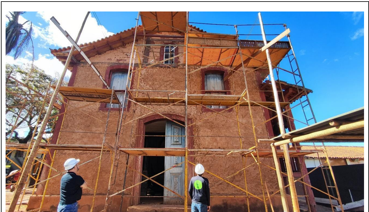
Análise e recuperação de trechos de alvenarias comprometidos

A visita foi guiada pelo responsável técnico da obra para análise das atividades em execução, bem como das etapas que já estão finalizadas. Foram iniciados os serviços de recuperação de trechos comprometidos do reboco das alvenarias externas, conforme imagens abaixo: