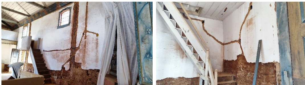
Abertura das alvenarias para passagem da infraestrutura elétrica.