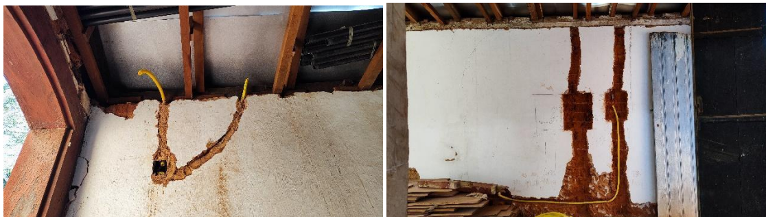
Abertura das alvenarias para passagem da infraestrutura elétrica.