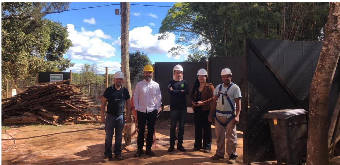
Equipes da Plataforma Semente e do Joaquim Artes e Ofícios