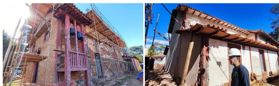
Intervenção no telhado da edificação Autoria: Francielle Ferreira Data: 05/08/2024